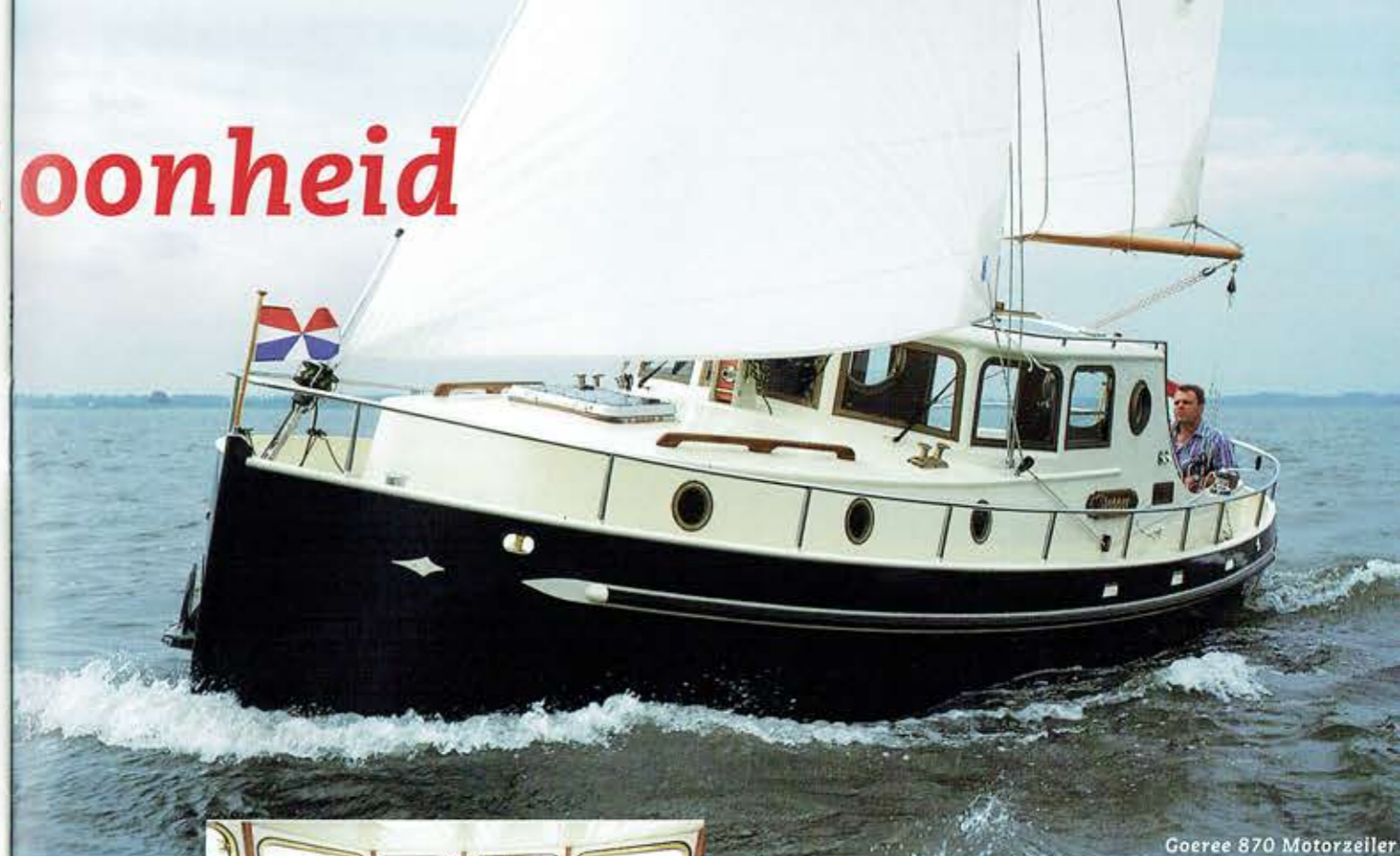
Goeree 870 Motorzeiler